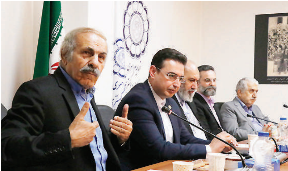
رئیس کمیسیون ورزش: وکیل علیرضا امینی

ورزش و تربیت‌بدنی یکی از اجزای جدانشدنی زندگی انسان‌هاست. این مهم با وجود پیروی بشر از زندگی ماشینی امروز و البته مصائب و مشکلاتی که ساختار زیست شهری متوجه حیات پرهیاهوی مردم جهان کرده، اهمیت پرداختن به آن را بیش از هر زمان دیگری کرده است. ارزش فعالیت بدنی و ورزش امروزه به حدی است که پزشکان و همه فعالان مرتبط با حوزه سلامت روح و جسم انسان‌ها توصیه می‌کنند، هر فردی در طول شبانه‌روز، باید یک بخشی از وقت خود را صرف پرداختن به امور ورزشی و تربیت‌بدنی کند. البته جدای از تکلیف افراد برای پرداختن مداوم به ورزش‌های انفرادی، برخی مشاغل هم هستند که به‌واسطه شرایطی که دارند، ورزش و تربیت بدنی برای آن‌ها همواره توصیه و تأکید شده است. یکی از این مشاغل، شغل