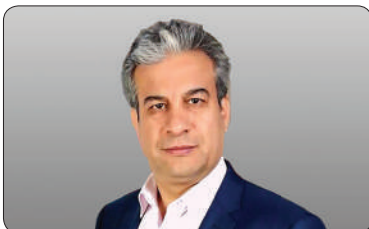
دکتر محمود حبیبی، نایب رئیس دوم