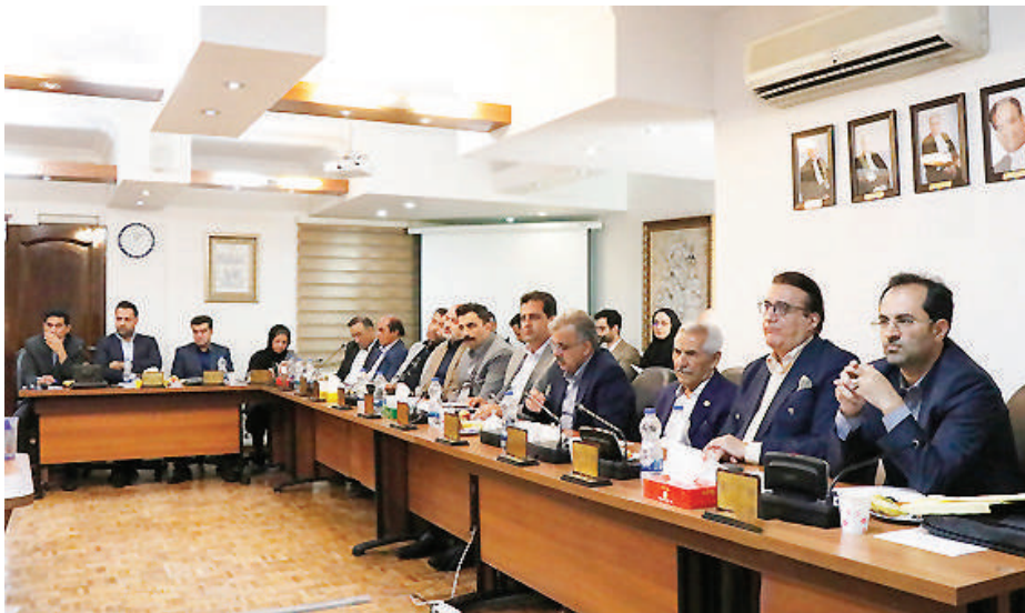
مسئول تهیه و تنظیم: مومن لازمی

شورای اجرایی اتحادیه سراسری کانون‌های وکلای دادگستری ایران متشکل از نمایندگان همه کانون‌های وکلای دادگستری در کشور و یکی از شوراهای فعال در نهاد وکالت است که به طور مستمر جلسات خود را ماهیانه با حضور اعضا برگزار می‌کند.